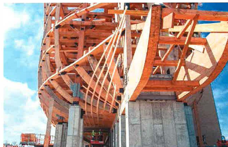
• Når arken står færdig, vil den bl.a. indeholde mere end 130 skærme, herunder billeder af Noas stalde og modeller af dyr.