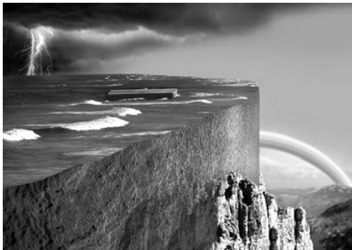
Локальное наводнение нелогично

Более 75 процентов площади материков покрыто осадочными горными породами. Эти слои песка, почвы и природного материала, покрытые в основном водой, раньше были мягкими как грязь, но теперь затвердели как камень. Миллиарды живых организмов, животных и растений погребены в этих осадочных слоях, и погребены они были очень, очень быстро. Подтверждения этому находят по всей Земле!