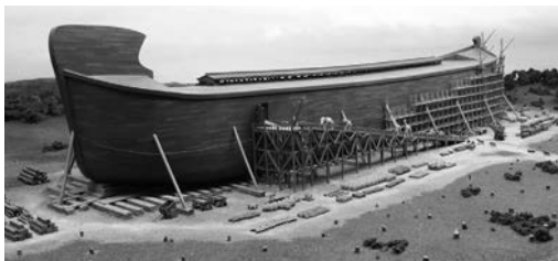
Размер ковчега понятен, только если потоп был Всемирным

Если потоп был только локальным, как вода могла подняться на 6 метров выше всех гор (Бытие 7:20)? Вода стремится к общему уровню. Она не могла подняться, чтобы покрыть местные горы и при этом оставить остальной мир нетронутым. 6