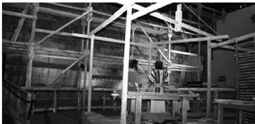
Один из потрясающих экспонатов в музее творчества неподалёку Цинциннати, штат Огайо, посвящён строительству ковчега.

Размеры ковчега впечатляют и сегодня, несмотря на развитие судостроительной отрасли и размеры современных океанских судов: его длина была, по меньшей мере, 137 м, шири —